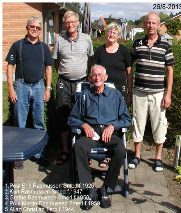
Foto fra sammenkomst i Ulstrup 2013